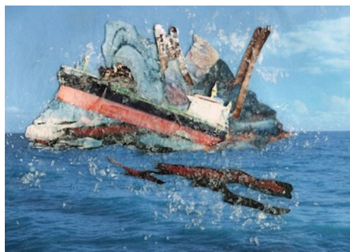
Gayle Chong Kwan, Crysanthi South Africa 2019 , series 'Oil Spill Islands', 2021, collage.

In quanto vincitrice del Sustainable Art Prize, promosso dall'Università Ca' Foscari Venezia in collaborazione con Art Verona, dal 2019 l'artista ha sviluppato, attraverso workshops e riflessioni con studenti e accademici, Waste Matters , un progetto i cui esiti prenderanno forma a partire dal 2 luglio sulla facciata della sede centrale dell'Università, accompagnati da attività partecipative e contributi online.