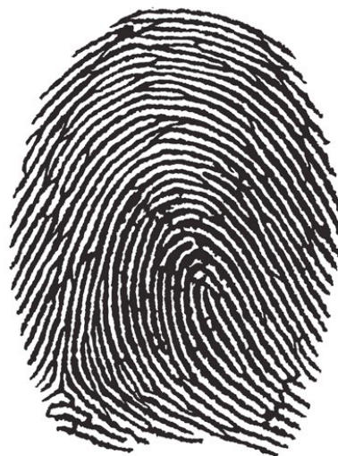
Right hand middle finger

Right hand middle finger, 2012 Impression A4