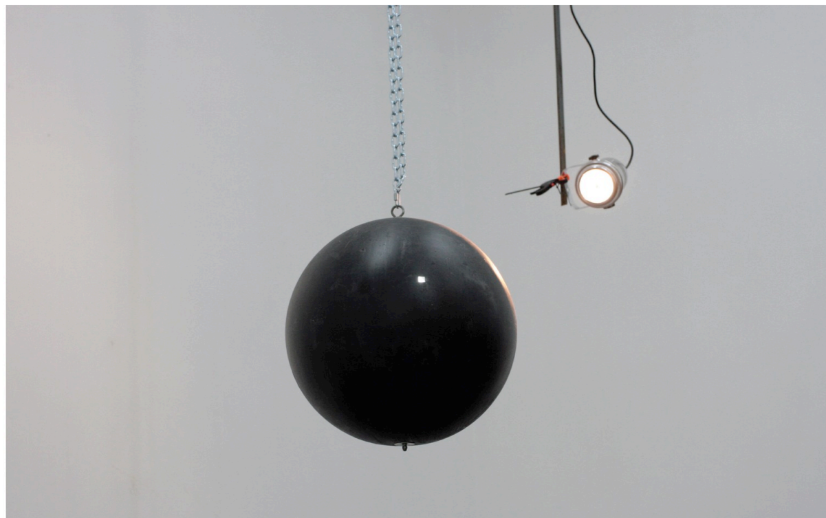
Sans titre , 2010 Installation, balle, miroir, chaîne, moteur, spot