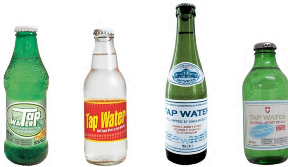
Tap Water (Zurich), 2009; Tap Water (Stuttgart), 2008; Tap Water (Vienne), 2008; Tap Water (Sofia), 2007 Bouteilles en verre et eau du robinet