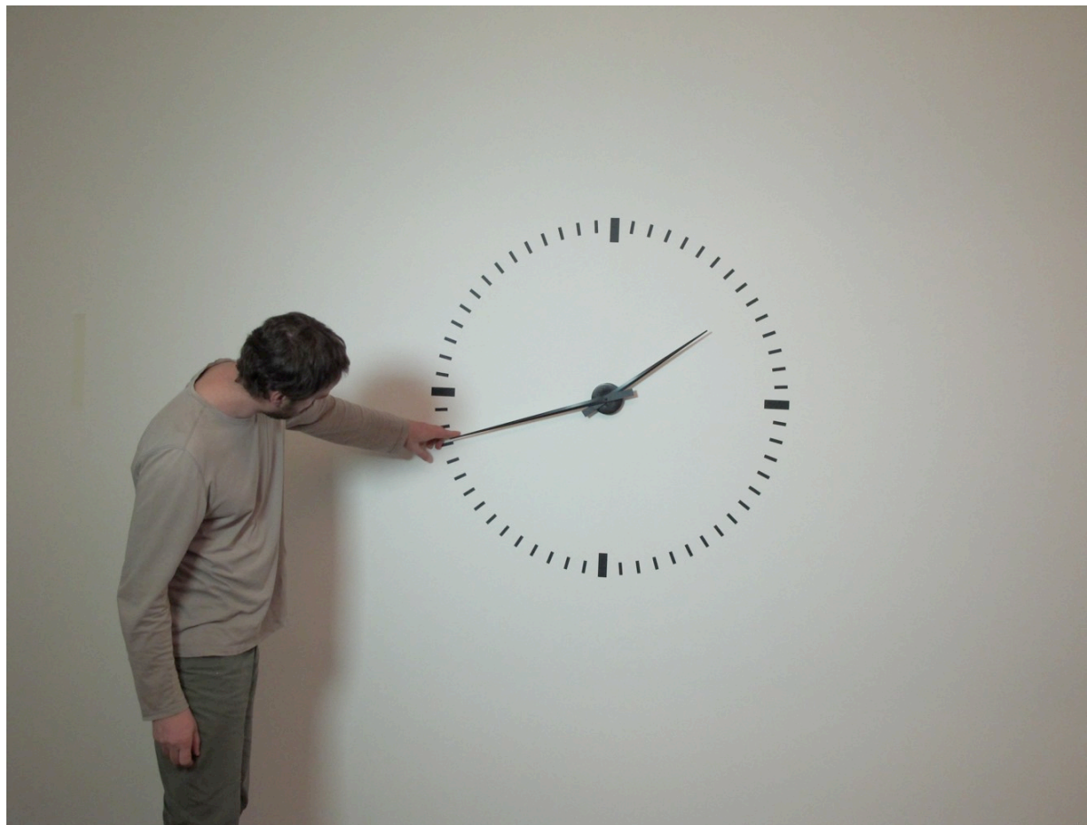
Performing time , 2012 Performance, pendule, dimensions variables