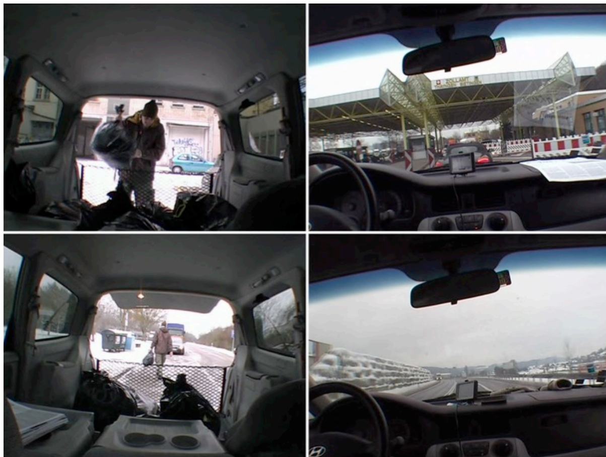
Garbage , 2009 Vidéo 60 min en boucle, texte