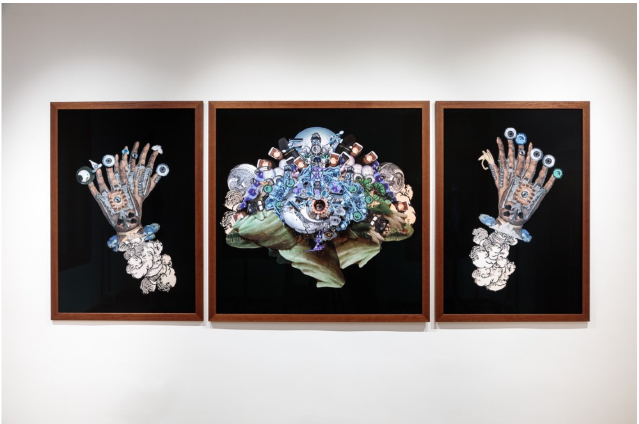
Gayle Chong Kwan, Cyclops , 2024, impression photographique encadrée (triptyque), 117 x 83 cm (côtés), 117 x 117 cm (partie centrale).

La série Cyclops de Gayle Chong Kwan a été produite dans le cadre de l'exposition ULYSSES. We are all Heroes présentée à la Fondation Valmont, Venise, Italie, du 20 avril 2024 au 23 février 2025.