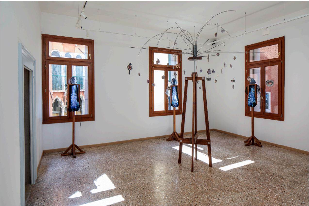
Vue de l'exposition Ulysses. We are all Heroes , 2024, Fondation Valmont, Venise, Italie. Installation Cyclops , 2024, trépied en bois, métal et photographies, 230 x 75 cm (bois).

La série Cyclops de Gayle Chong Kwan a été produite dans le cadre de l'exposition ULYSSES. We are all Heroes présentée à la Fondation Valmont, Venise, Italie, du 20 avril 2024 au 23 février 2025.