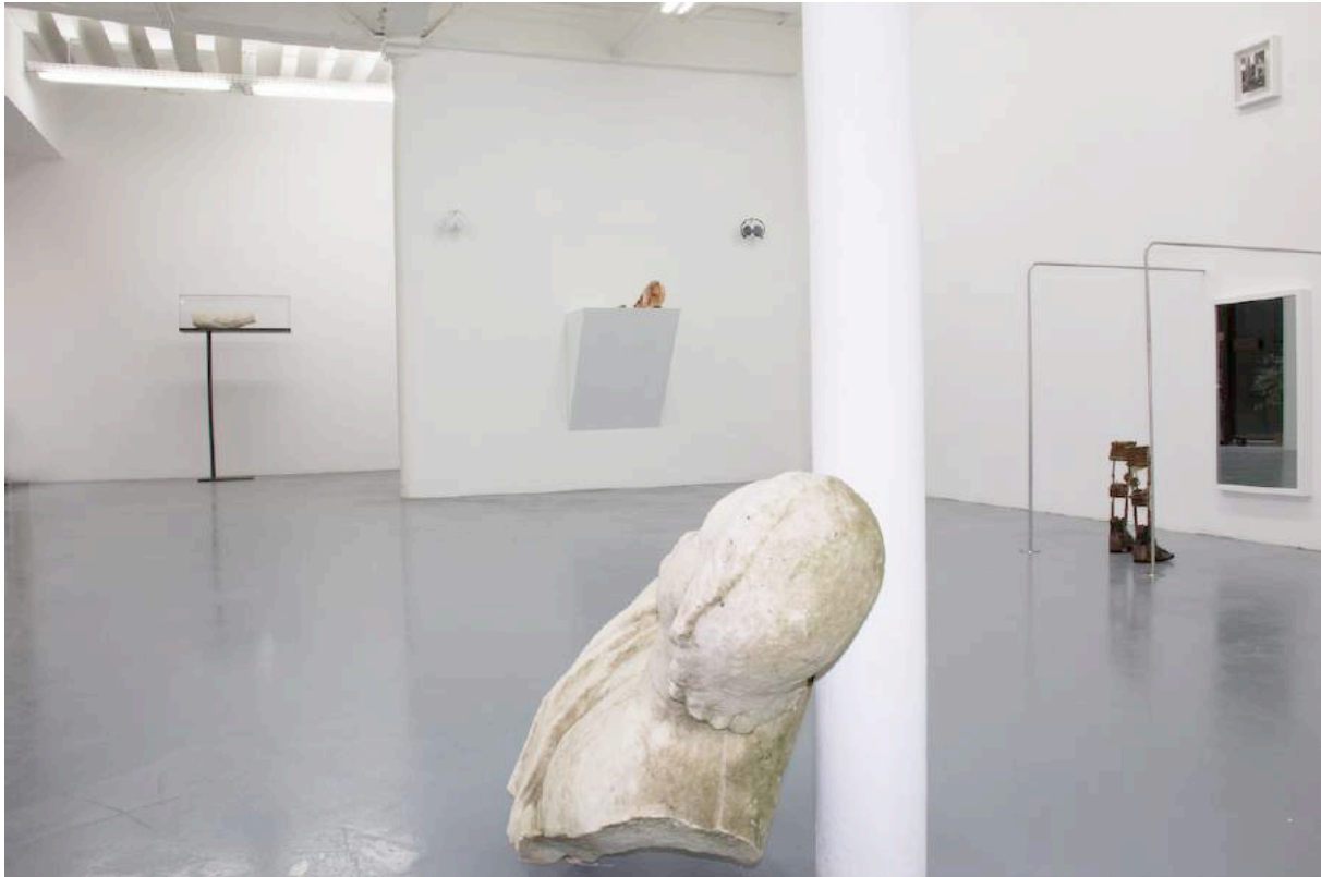
Vue de l'exposition Le monde du ticqueur , 2016, Galerie Alberta Pane