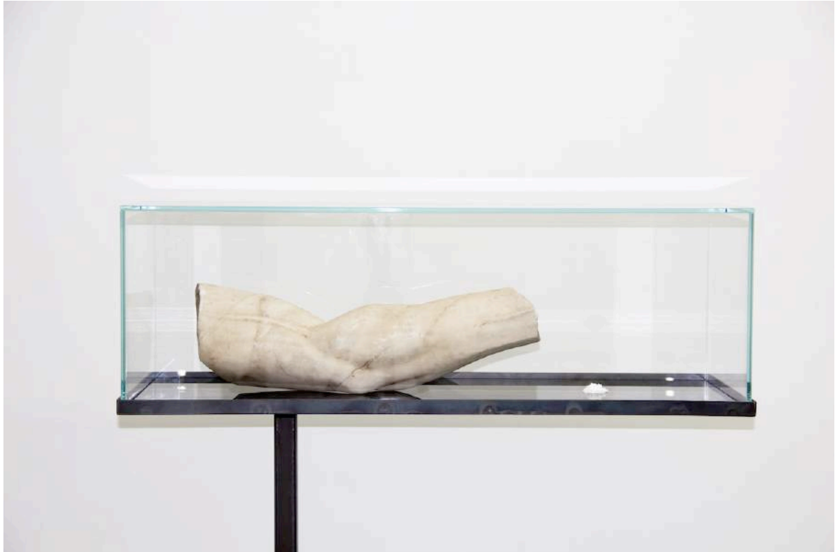
Lithos , 2016

La réflexion de Christian Fogaroli se centre sur l'analyse de l'interaction entre la perte et la récupération et l'impact de ces dernières sur les différents organismes. Comment et selon quelle dynamique les animaux, les plantes et les êtres humains réagissent face à une perte physique ou psychique? Quelles sont les similitudes et les différences? Comment change la perception de chacun devant ces mutations?