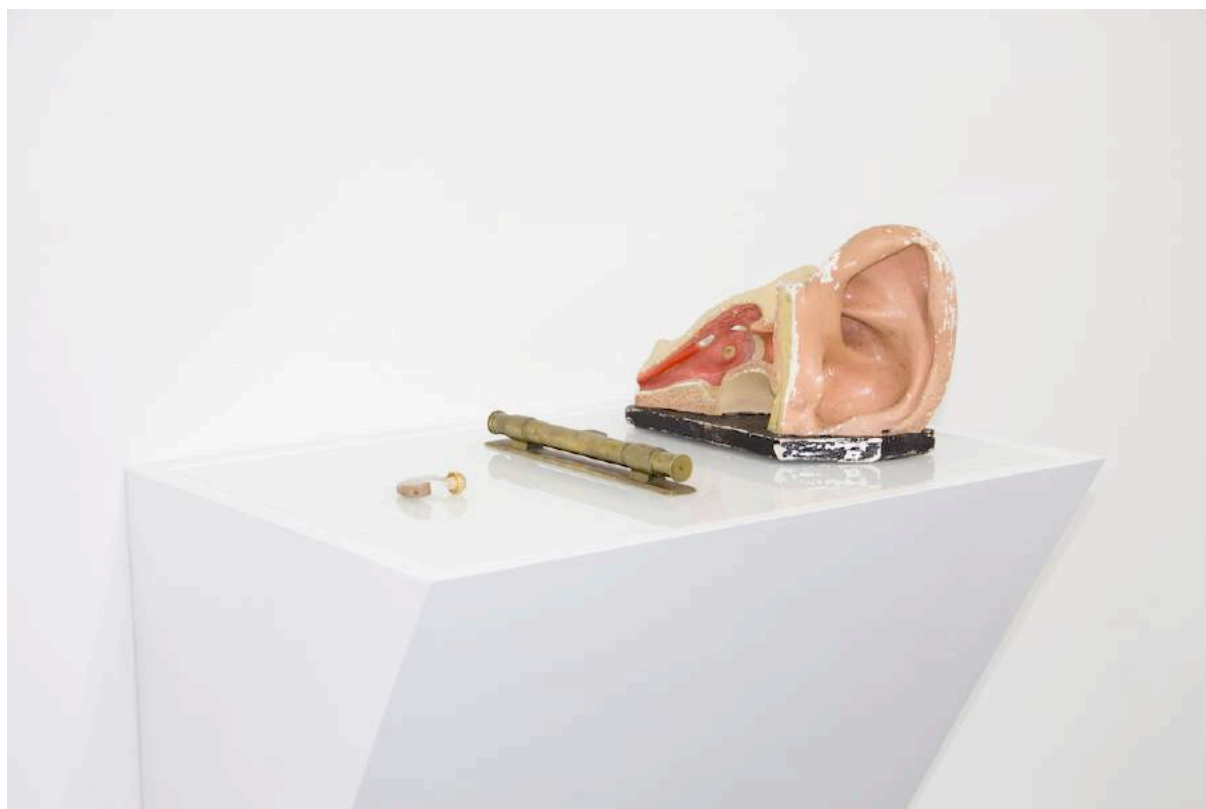
Fantômes de la musique , 2016, installation

GSC : En parcourant ton travail récent et très intense d'artiste, on y retrouve de façon évidente le fil de ta recherche autour de la mémoire, de l'identité, des archives, des traces ; elles ressurgissent de tes études d'archéologie, de conservation du patrimoine artistique et de sa gestion, de technologie, de restauration de peintures anciennes et contemporaines.