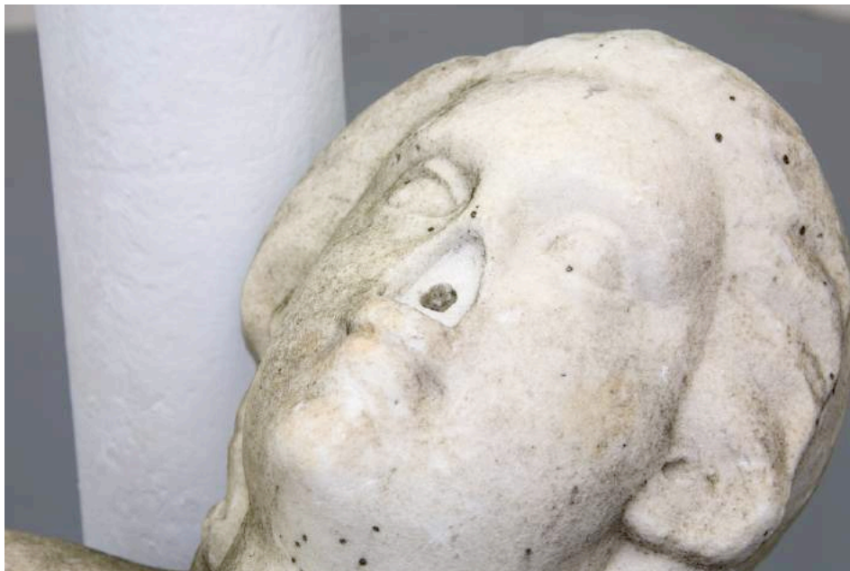
Anosmie , 2016, installation

J'essaie de regarder toujours vers le futur avec les yeux du passé, je me souviens du regard du chirurgien esthétique quand je lui ai demandé de reconstruire le système olfactif d'un buste de pierre mutilé du XVIII ème siècle. Peut être que ceci a été la requête la plus absurde de sa carrière (« Anosmie », 2016).