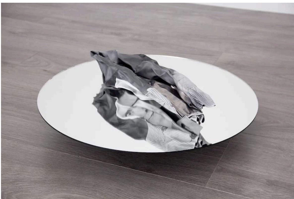
Christian Fogarolli, Amoral , 2015, impression pigment sur plomb, miroir, fer, diam: 40 cm