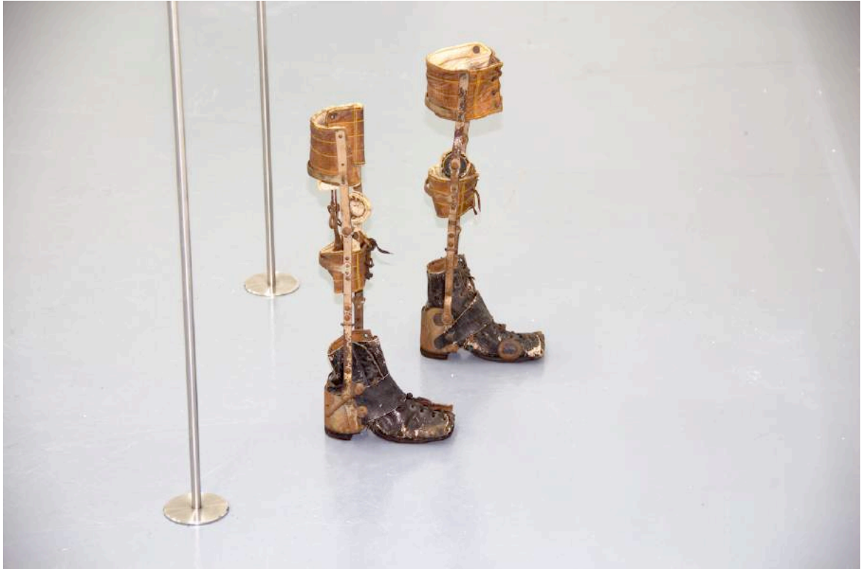
Promeneur , 2016, Installation