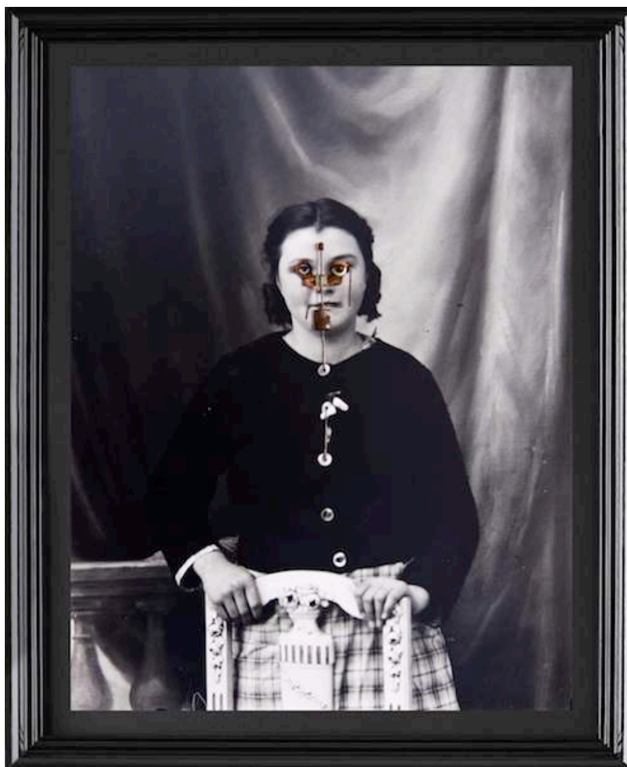
Christian Fogarolli, Left , 2014, objets sur photographie argentique issue d'un négatif sur verre, 57 x 45 cm.