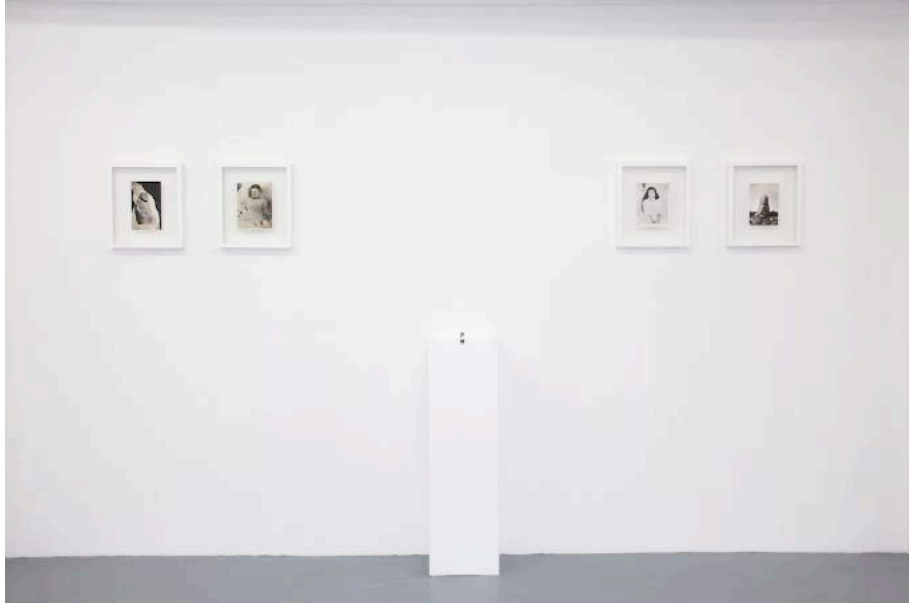
Remember , 2016, installation

Ce renversement du moi vers « l'autre » peut être aussi perçu dans des travaux comme Fétiche , où le système identitaire est transféré dans le souvenir d'une mère qui vient de perdre son enfant vers une poupée. Les victimes du narcotrafic colombien prises en photos se confrontent avec ces fétiches, des habits élaborés et construits par les mères qui avec la force de la mémoire ont recousu la physionomie, en créant une nouvelle créature qui va devoir se substituer à celle perdue.