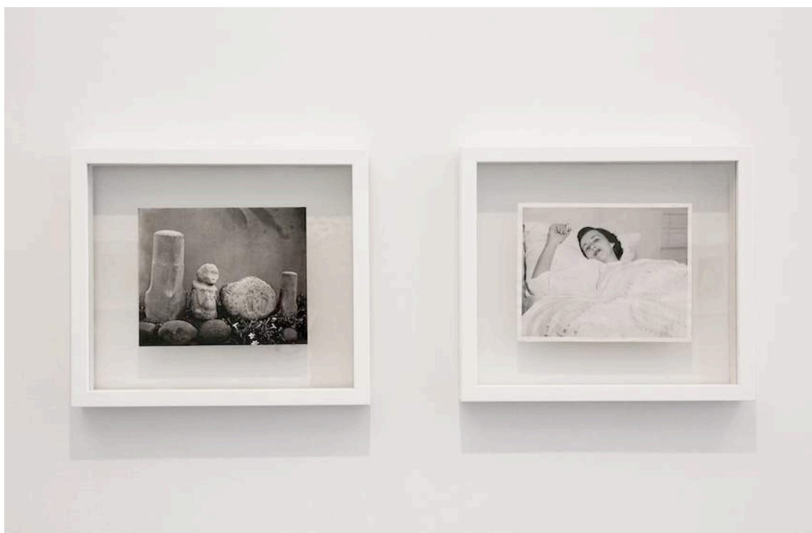
Christian Fogarolli, Repeat , 2015, 6 photographies d'archives, 38 x 33 cm ; Vue de l'exposition Spell to Spelling ** Spelling to Spell , commissariat : Inga Lacie, Rani Lavie, C. Ianeselli, De Appel Arts Centre, Amsterdam, Pays-Bas