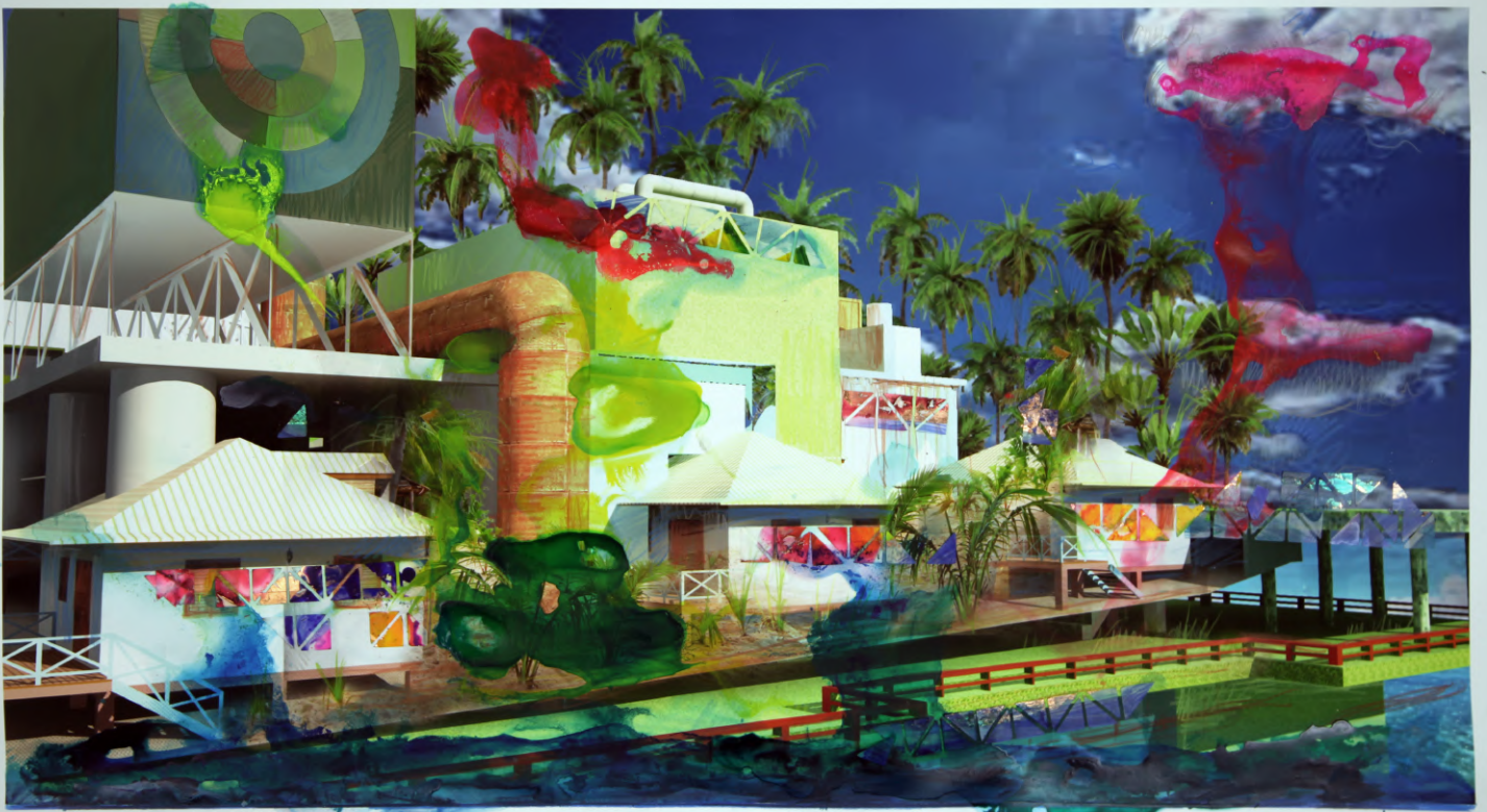
Marcos Lutyens, Island Ark III , 2019, encre, acrylique, graphite, Duralar sur impression giclée, papier de qualité Archive, 49 x 83 cm.