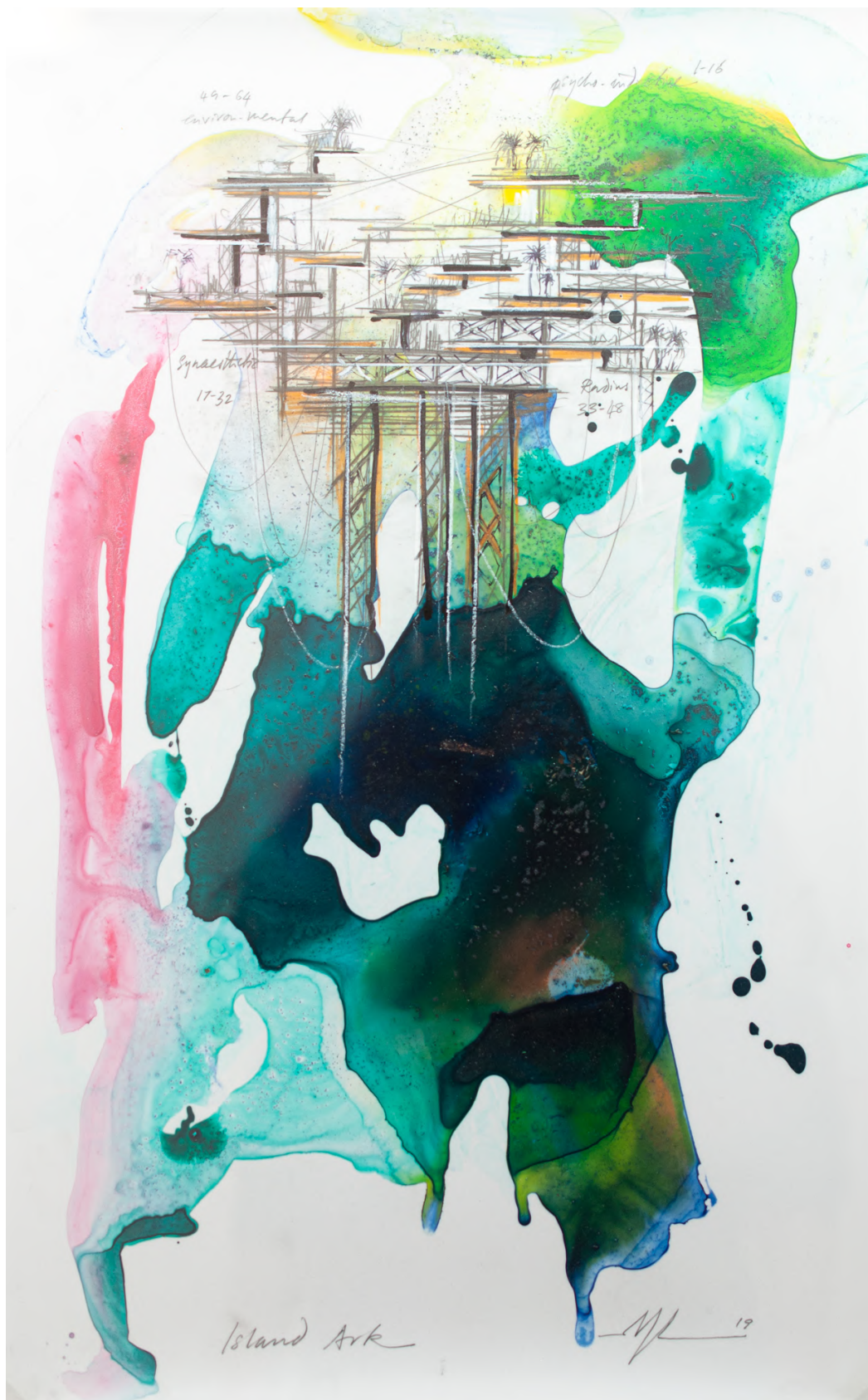
Marcos Lutyens, Island Ark I , 2019, encre, acrylique, graphite, Duralar sur impression giclée, papier de qualité Archive, 65 x 45 cm.