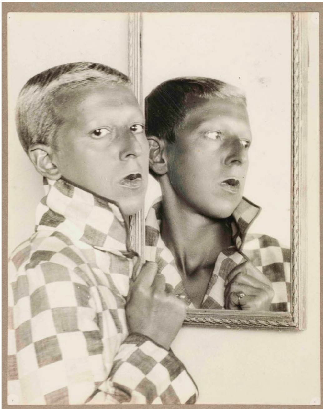
Claude Cahun, Untitled, Self-portrait , circa 1928, photographie, impression gélatino-argentique, 30 x 23,8 cm.