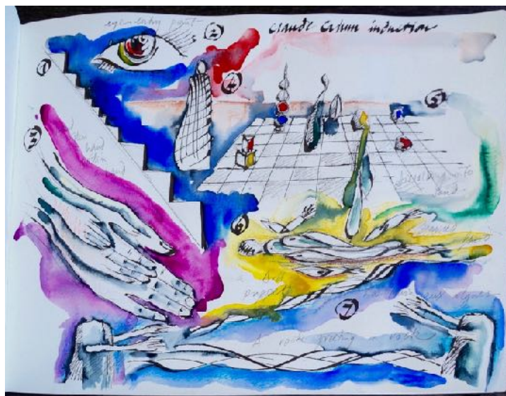
Marcos Lutyens, Cahun Induction Score , 2022, Impression Fine Art sur papier Hahnemühle Photo Rag 308g, 18 x 25 cm. Édition limitée. Signée et numérotée, proposée avec le catalogue de l'exposition.