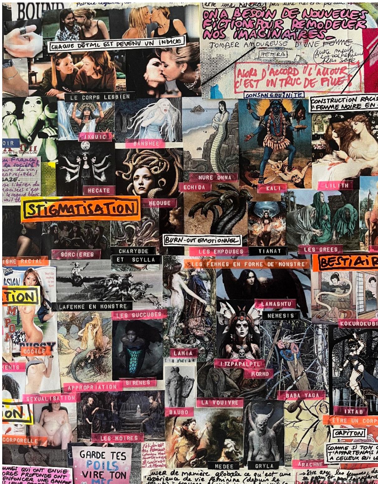
Marielle Chabal, QUEENS Project, Moodboard #1 , 2024. Riviste, agosto 1997 e settembre 1998, Jeune & Jolie, luglio 1999 e maggio 2003, Vogue, giugno 2010, notebooks, aprile 2020 e maggio/ giugno 2022, ritagli da poster del programma OPP-OPS, catalogo La Redoute, primavera-estate 2002, Pétromasculinité di Cara New Dagget, carta stampata, inchiostro e penne gel, colla a caldo colorata, volantini Attac militant distribuiti dai Rosies di Amiens, Lash "barbie pink" glitter, plastica vinilica Jennifer, smalto per unghie Nars "My fuschia life", filo da cucito Hema beige, rosa pallido e lavanda, macchia di caffè Richard, assemblaggio di cristalli di zinco biologici e Loscher club Maté, mini fascetta tipp-ex, pastello secco Colorado Schmincke rosa extra-soft, fard rosa Bourgeois coup de foudre, nastro di plastica Hema rosa, arancione, nero, trasparente, blu chiaro e scuro, legno ayous tinto, cartone grigio riciclato, 128,5 x 90 cm.