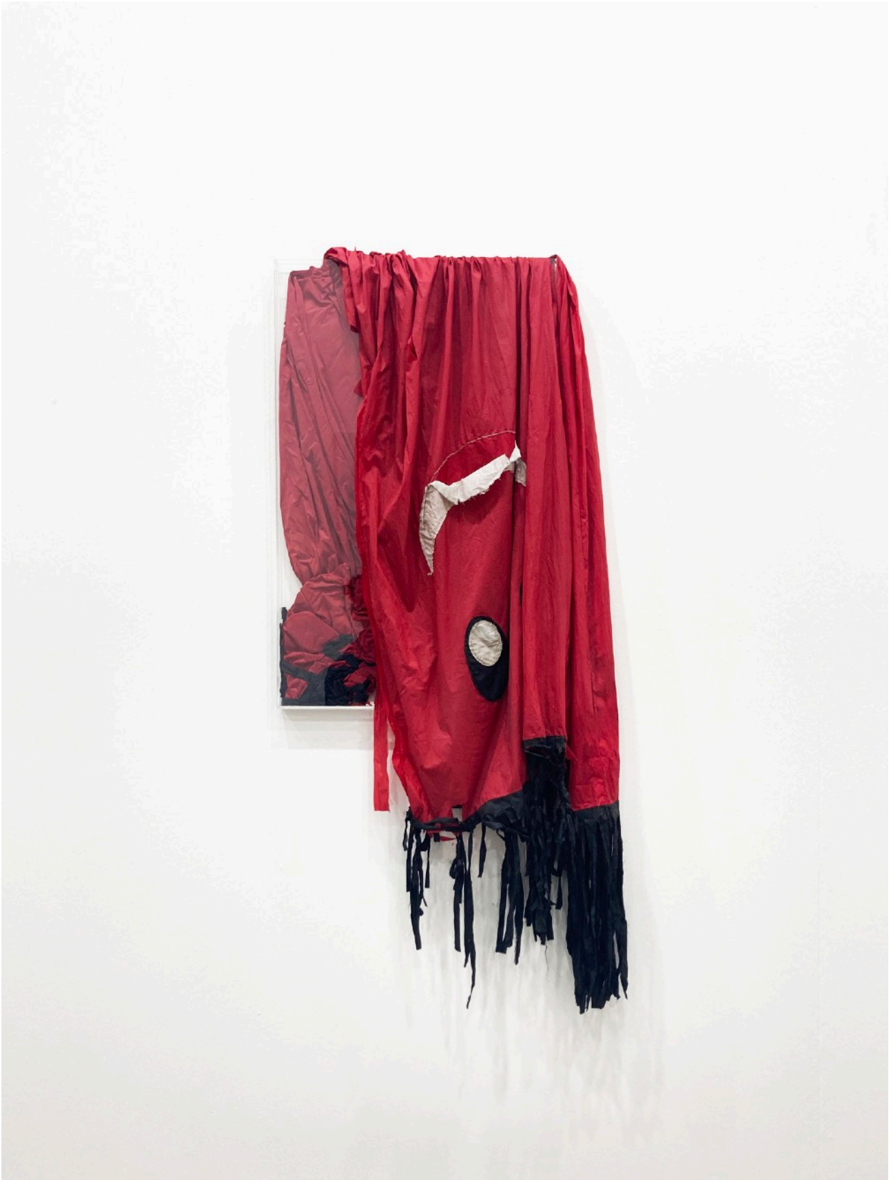
Davide Sgamaro, Off the Hook! , 2023, skydancer rossa, plexiglass, 80 x 50 x 5 cm, edizione 1/1 + 1AP.