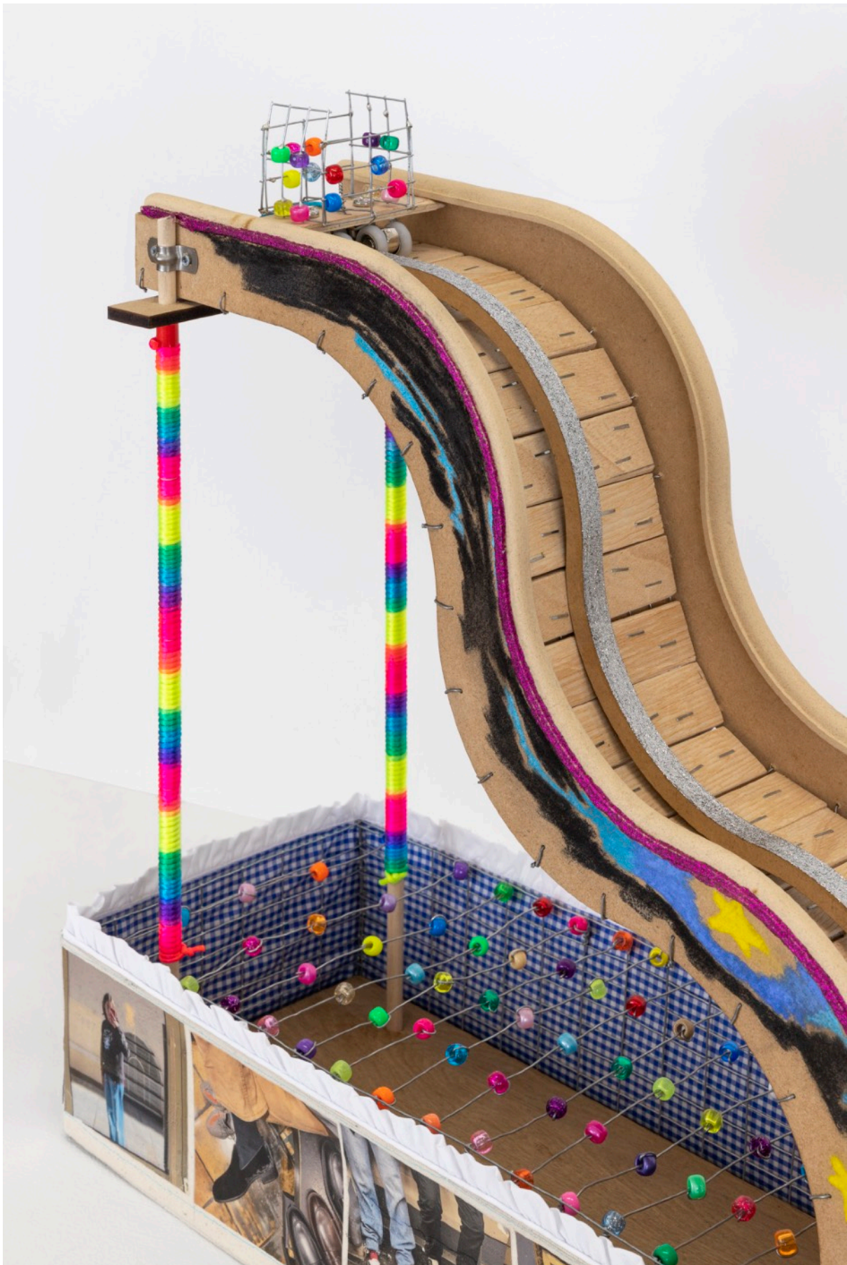
Guendalina Cerruti, Life is a Rollercoaster , 2023, legno, perline di plastica multicolore, rete metallica, paillettes, colla, pastelli, cordoncino arcobaleno, trasferimento fotografico su tela, tessuto, 73 x 20 x 55 cm.