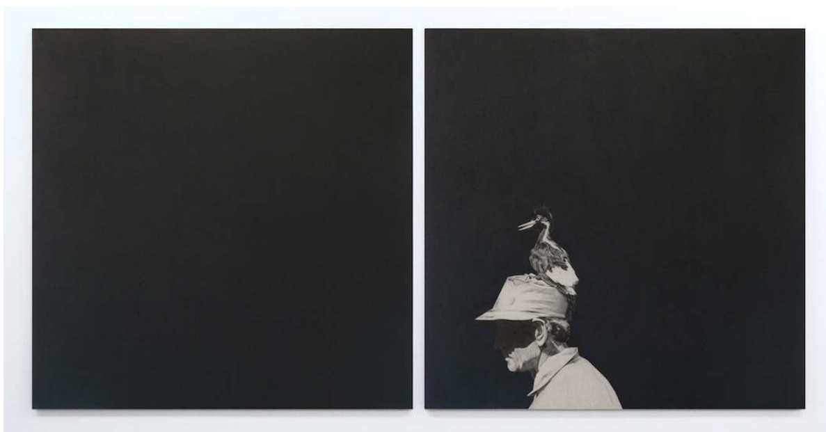
Lettre d'ivoire , 2017, pierre noire sur carton gris, 101 x 202 cm