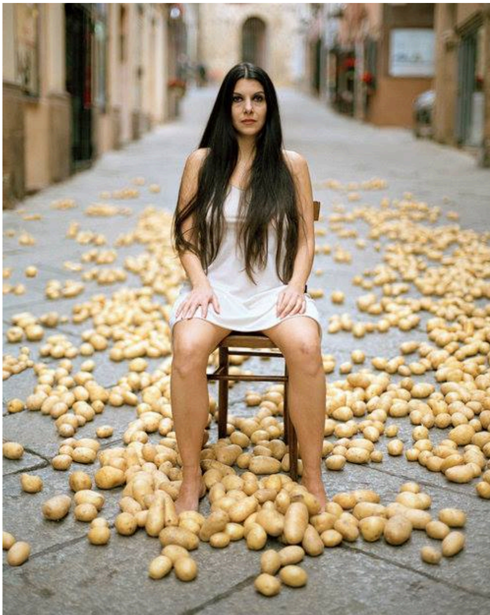
Bella Ciao , 2016, Photographie argentique sur aluminium, 100 x 80 cm, Ed 3 + 2EA