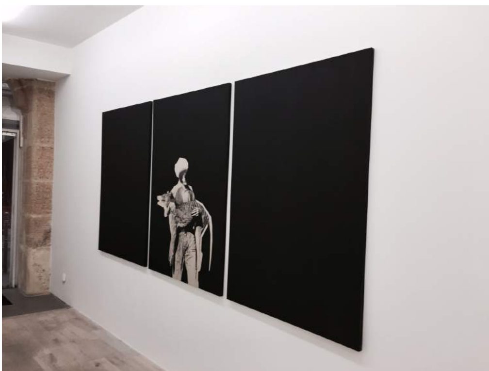
Lettre Rayée , 2017, Pierre noire sur carton gris, Triptyque, 140 x 303 cm