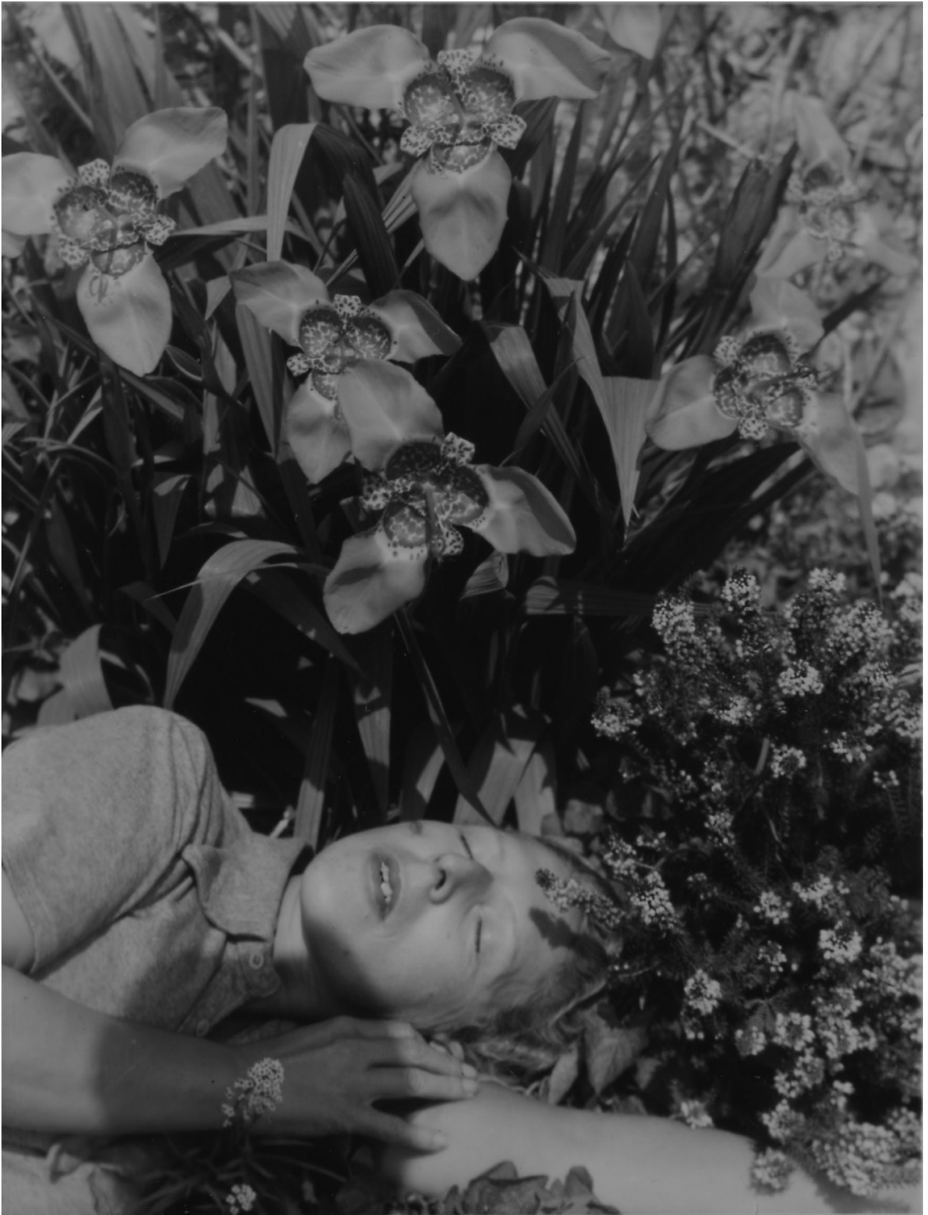
Claude Cahun, Autoportrait aux orchidées , 1939, tirage gélatino-argentique en noir et blanc sur papier Velox, 10,2 x 7,8 cm.