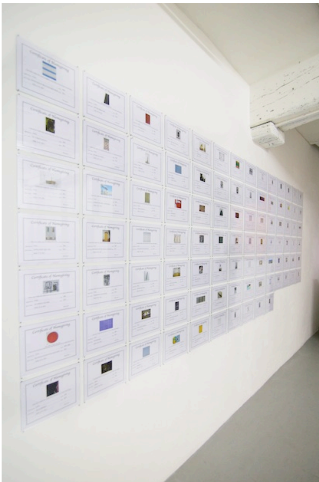
Certificate of Name Giving , 2013, Installation, 94 impressions sur papier (24,7 x 19,7 cm), verre