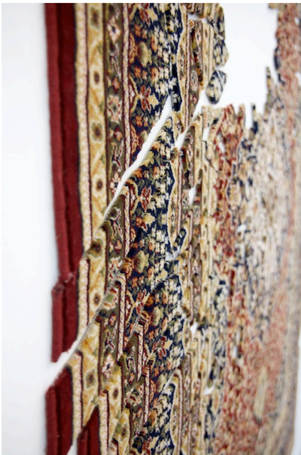
Ornaments of Demand , (détail), 2013 Tapis découpé monté sur mur 248 x 176 cm