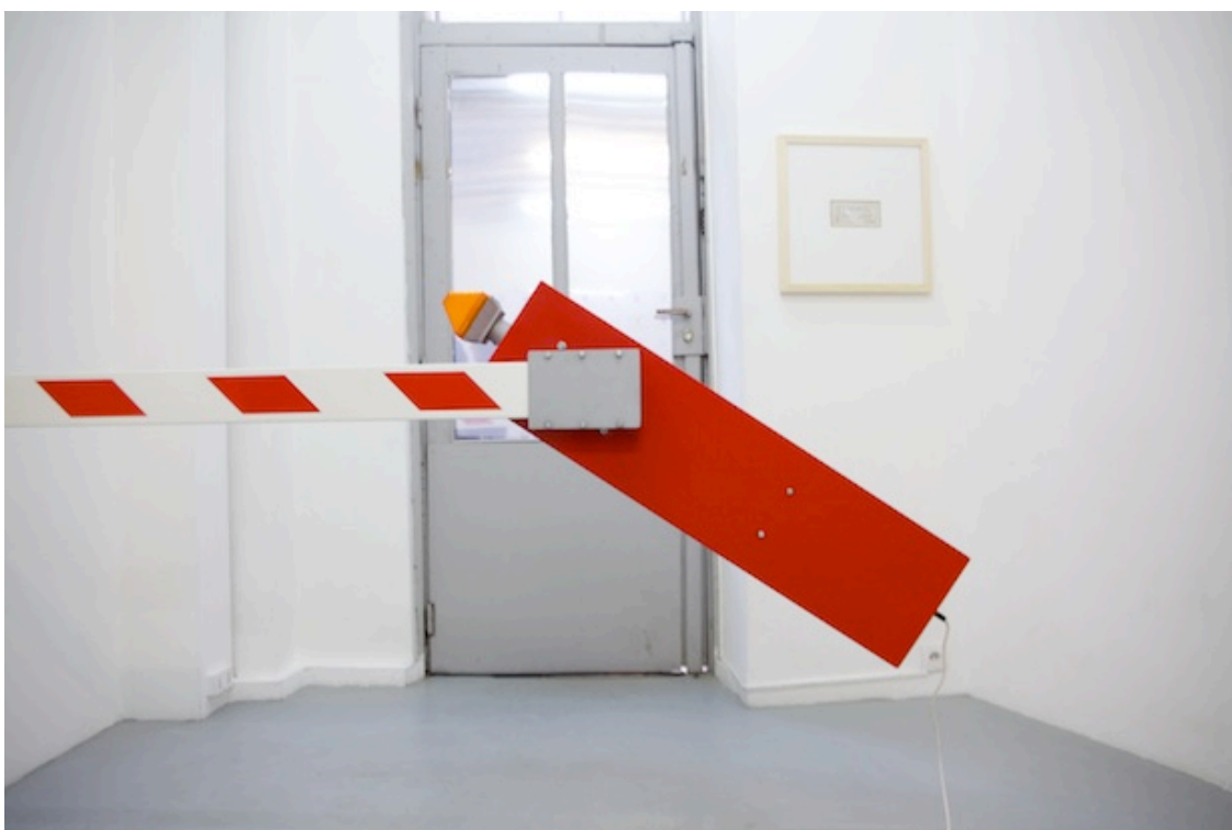
Vue de l'exposition Fragments of Demand , 2013, Galerie Alberta Pane There are No Forbidden Thoughts , 2007, installation, métal, moteur électrique, timer, Courtesy Sariev Contemporary, Plovdiv, Bulgaria