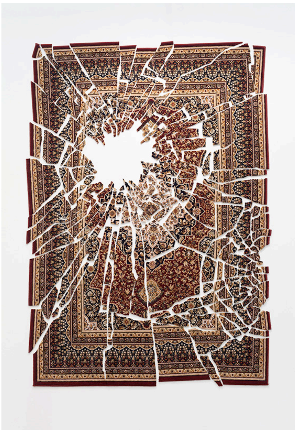
Ornaments of Demand , 2013 Tapis découpé monté sur mur 248 x 176 cm