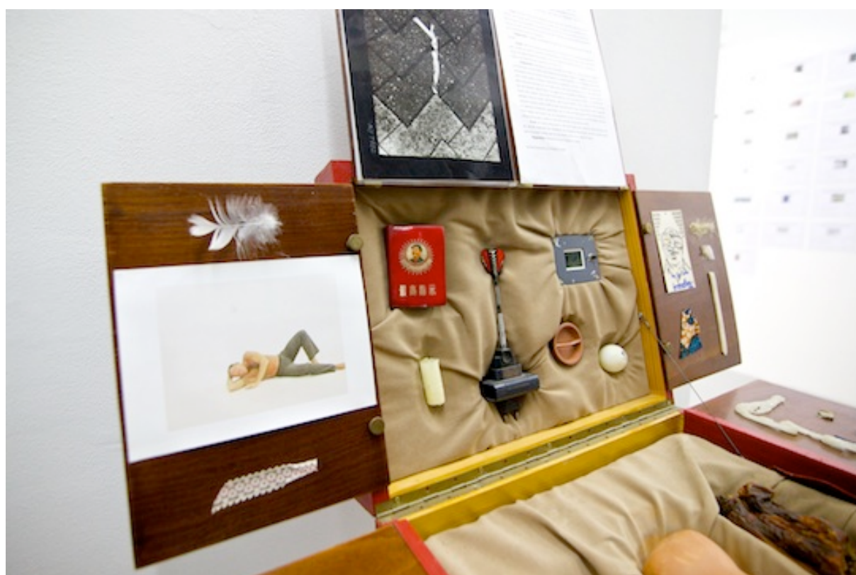
Fragments (Box #2, Paris), 2002-2007, Boîte faite main, fragments volés 50 x 36 cm